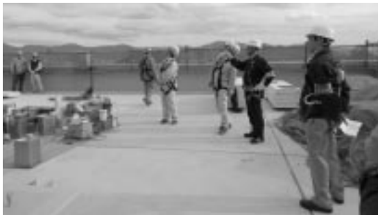
（現場のパトロール状況）

年末年始の労働災害防止運動をさらに徹底、推進していただき、全工期無災害で工事を完成されるようお願いしました。