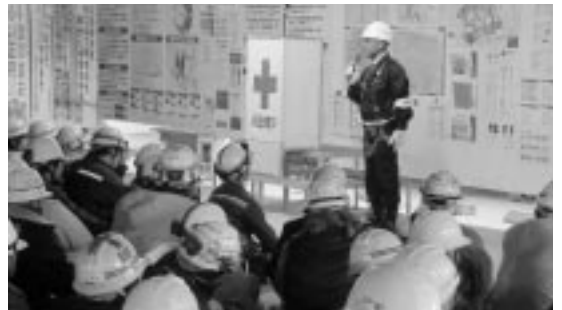
（広島労働局長による激励）