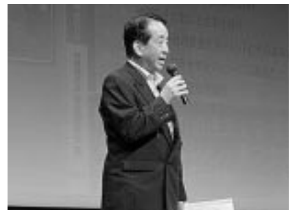
「閉会のことば」依副支部長（広島分会長）

本大会は、福山分会の実行委員の皆様のご協力を得て成功裏に終了しました。改めて多くの関係者の皆様に感謝とお礼を申し上げます。