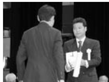
功績賞受賞者代表