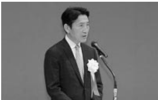
檜山支部長の挨拶

檜山支部長より「建災防は昨年創立50周年を迎え、今年は新たな第一歩を進める記念すべき年に9年ぶりに福山市での大会を開催することができた。行政をはじめ関係する多くの方々の懸命な努力の結果、50年間に災害はピーク時の10分の1になったが、ここ数年は技術者・技能者の不足、職場の高齢化、未熟練労働者の災害の増加などから、増減を繰り返し減少に向かわない状況にあり、併せて昨