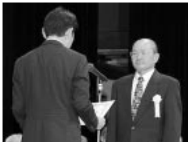
優良賞（会社）受賞者代表