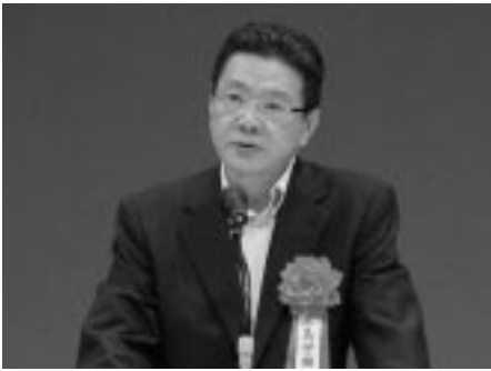
星広島労働局長の祝辞

運動である『建設業フィンガー・チェック運動』を県内で開始したので是非協力していただきたい。」とのお話がありました。