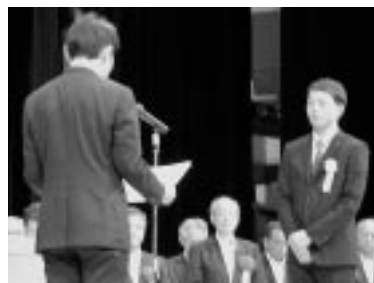
優良賞（工事現場）受賞者代表