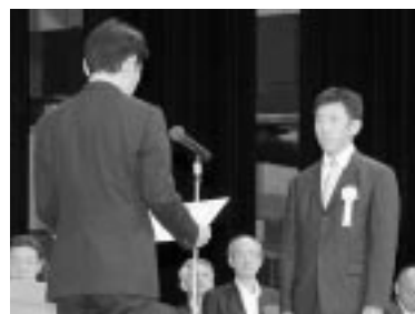
功労賞受賞者代表