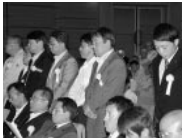
優良賞（工事現場）受賞の皆さん