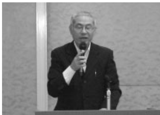
新庄主任産業安全専門官