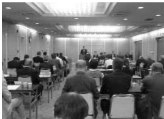
第51回通常総会全景