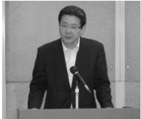
星直幸 広島労働局長